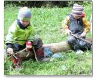
Schnitzen: Bewegung, Gesundheit, ästhetische Bildung,