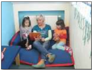
Lesen: Sprache, Soziale Bildung, Medien

Hierzu wieder ein paar Fotos unter denen jeweils die vorrangigen Bildungsbereiche aufgeführt sind: