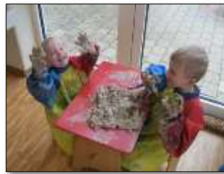
Knettisch: Feinmotorik, Sensomotorik, Gesundheit