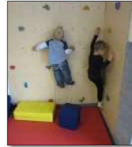
Bewegung, Körper, Gesundheit, Sprache, Kommunikation, Soziale Bildung, Mathematische Bildung

Ein sehr abwechslungsreiches Außengelände mit seinen verschiedenen Sträuchern, Obstbäumen und einem Nutzgarten, bietet den Kindern eine Vielzahl von Möglichkeiten an, mit den Elementen der Natur in Kontakt zu treten.