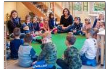
Sitzkreis: Bewegung, Musische Bildung, Religion, Ethik