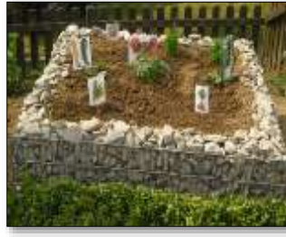
Gartenpflege: Ökologische Bildung, Naturwissenschaft