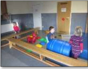
Psychomotorik: Bewegung, Gesundheit, Soziale K.