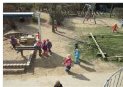
Ökologische Bildung, Bewegung, Gesundheit, Sprache, Kommunikation